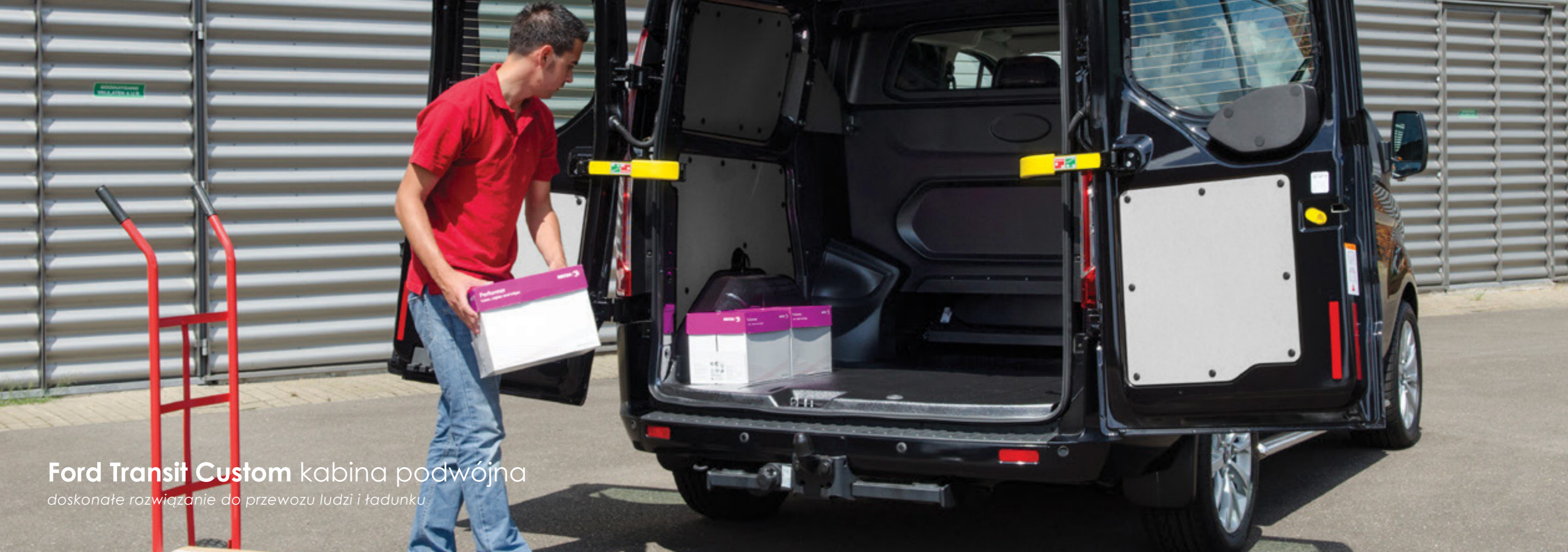
Ford Transit Custom kabina podwójna doskonałe rozwiązanie do przewozu ludzi i ładunku